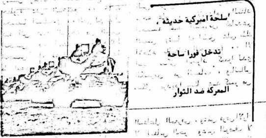
الاسلحة اميركية حديثة تدخل فوراً ساحه المعركة ضد التوارق

ومن ناحية اخرى تحدثت صحيفة هيرالد تريبون الاميركية في مقال طويل نشرته على صفحاتها الاولى عن حرب نظام الملك الحسن الثاني ضد جبهة تحرير الصحراء الغربية بوليساريو . وأشارت بشكل خاص الى الحملة العسكرية التي يشنها الجيش المغربي في المرحلة الحالية ضد مواقع الجبهة بقيادة الكولونيل احمد دليمي قائد المخابرات المغربية .