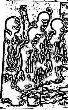
أطفال من جنوب أفريقيا - عن الدبلي وولد

وقد اعلن السيد ليزلي هاريمان رئيس اللجنة ان جنوب افريقيا حصلت منذ سنة ١٩٧٢ وحتى ١٩٧٨ على تسهيلات وقروض بمبلغ ٥٥٠٠ مليون دولار قدمتھا ٣٨٢ من البنوك في سائر انحاء العالم الراسالي . وجاء في تقرير اللجنة كما ذكرت مجلة "جين افريك" (عدد ١٨ نيسان ٧٩) ان النسيب الاكبر من هذه المبالغ قد قدمتھا بنوك ألمانيا الغربية وبريطانيا وفرنسا والولايات المتحدة وسويسرا . وقد ساعدت هذه القروض نظام برينوتريا العنصري على مضاعفة ميزانية العسكرية الموجهة لمحاربة الحركة الوطنية للإفارقة هناك والتي وصلت خلال عام ١٩٧٩ الى ٢ مليار دولار . وهكذا تتضح حقيقة مفهوم "حقوق الانسان" الذي طالما تشدق به كارتو والمسؤولون في الدول الغربية وتبين لدى سائر شعوب العالم ان هذا الشعار ما هو الا تغطية للاعمال المخزية التي تمارسها الاحتكارات في الدول الراسالية .