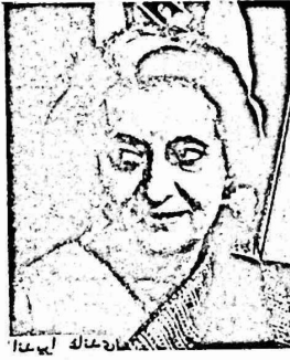
ملاحة ملكة ليوغيا

● الحاكم العسكري العام للضفة يصدر امرا عسكريا جديدا ضد اضراب المعلمين في المدارس الحكومية للذين ابتدأوا اضرابا تصاعديا للمطالبة برفع رواتبهم.