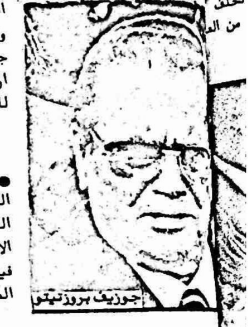
جوزيف بروز تيتو

لجنة حقوق الانسان برئاسة رئيس تحرير رابنتيه الشيوعية الفرنسية. في المناطق المحتلة. الماليب القمع ومصادرة التي تمارسها السلطات ضد الشعب الفلسطيني.