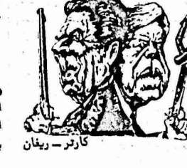
كارتر - ريفان

● في ليبيريا تم الاطاحة بديكتاتورية وليم طولبرت الموالي للامبريالية وتم اعدامه.