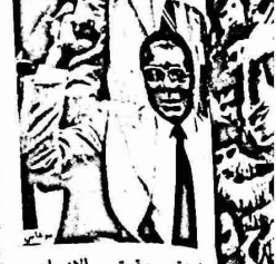
جوزيف بروز تيتو

سلطات الاحتلال ٦٠. الضفة والقطاع في الضفة الغربية