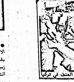
اعمال العنف في تركيا

● فرض اوامر الإقامة الجبرية في المناطق المحتلة على عدد آخر من القادة الوطنيين والنقابيين، حيث وصل عدد الذين فرضت عليهم الإقامة حتى الان الى ٢٥ مواطنا.