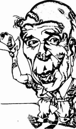
عام ٧٦ الى ١٢ بالمئة الآن السنوات ٥ القادمة لا تبشر بالخير .