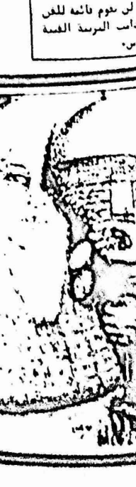
من اعمال الفنان خليل الدوح