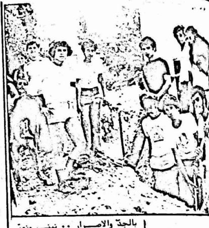
بالجدة والاصرار .. ننسي ونعمر على أياديكم وأقول أفديكم

كما وردت في البيان المشوه اياه اسما لجان عمل او مؤسسات لا وجود لها . وجاء في البيان ان جامعة بيروت قررت عدم الاشتراك رسميا في المخيم (الجامعة لم تعلن ذلك والمجلس شارك بنشاط وفي الناصرة اطلق اسم بيروت على احد الشوارع المنجزة في المخيم تقديرا لجهود الفرقة التي شاركت من بيروت) . كما جرت الاثارة في حفل الاختتام بجهود المتطوعين من نادي الموظفين بشكل خاص (شارك من النادي ٧٠ متطوعا انسحب منهم ٣ وبقي ٦٧ حتى آخر ايام المخيم) . وهكذا يلتقي هذا البيان وملفقوه مع محاولات افشال المخيم في هذا الوقت الذي يعتبر فيه رئيس بلدية الناصرة مستهدفا ، والناصره بجبهتها وجماهيرها مستهدفة ويتضح من الحقائق السابقة كذب وزيف البيان والادعاءات الواردة فيه .