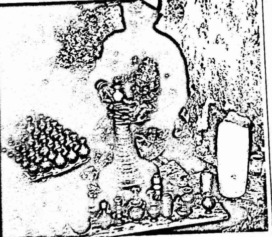
خزاف من الخليل