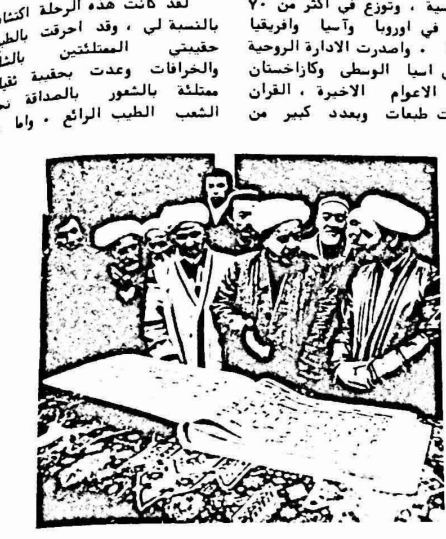
المفتي ضياء الدين خان بن ايشان باباخان يشرح تاريخ قرآن - الخليفة عثمان