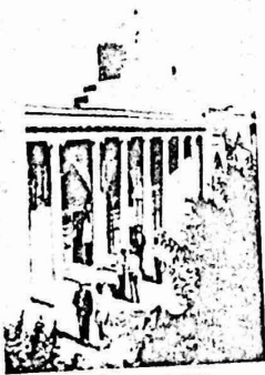
مدرسة الامام البخارى الدينية العليا في مدينة طشقند

في عام ١٩٧٨ عقد مؤتمر لعملي الطائفة الاسلامية ومساحد شمال القفقاس شارك فيه حوالي المئة من المشرفين على المساحد والقضاة وروسا الهيئات التنفيذية للمنظمات الدينية الاسلامية . كما انه يزور الاتحاد السوفياتي سنويا اكثر من ١٠٠ شخصية دينية اسلامية من مختلف دول العالم . في عهد القيصر وفي عام (١٩٠٤) اشترى قائد عسكري "مصعب عثمان" بثمن بخس واحتفظ به في المكتبة العامة للامبراطورية . ولم تفلح كل محاولات المسلمين لاستعادته ، وبعد انتصار الثورة اصدر لينين امرا بتسليم المصحف للمسلمين . وجاء في النداء الخاص