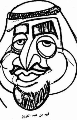
لهب من عبد العزيز

بنتفضها في اليمن الشمالي وذلك ضمن اطار تنفيذ "الاتفاق الامني" الموقع بين بغداد والرياض في السنة الماضية والذي يهدف الى اثناء محور رجعي تناط اليه مهمة مقاومة "الشوعية" والحركات التحررية والتقدمية في المنطقة وبالدراسة الاولى النظام الثوري في اليمن الديمقراطية والنورسين الاربابية والافغانية . واضافت هذه الوكالات ان قصف المحاولة الانقلابية بدأت باحتجاج سرى عقد في جناح قاسم سلام عضو - ما يسمى - بالقاعدة القوسية في حزب البعث العراقي ، وحضر الاجتماع الذي فاده قاسم سلام ،