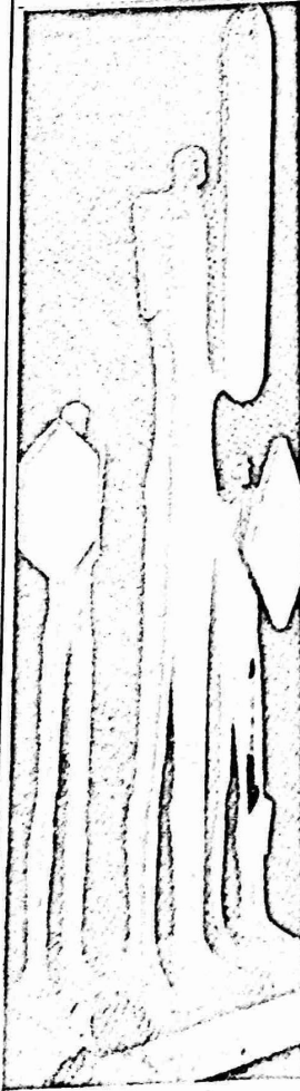
من اعمال الختاج