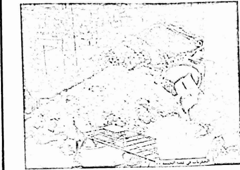
الحفريات في بيت السبب

وسائل مواظي آخر "الى متى يدوم هذا الحال المرعب؟؟"