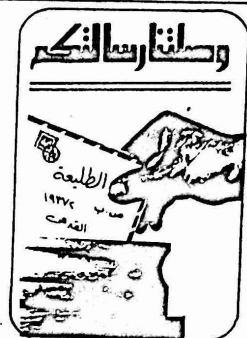
حضرة رئيس التحرير تحية وبعد،

ولن نزع، في هذه الحالة تحقيق ان ذلك بالامر اليسير نهر يتطلب تنفيذ سلسلة من الاجراءات والاقتصادية والسياسية والاجتماعية لا يمكن توفرها الا باقامة دولة فلسطينية مستقلة. ومع ذلك فان السكوت على هذا الوضع لن يؤدي الا الى تفاقم خطورته، ومن المقترح اجراء الدراسات ومعرفة الامكانيات التي تساعد على التخفيف من وطأة المعاناة التي يعيشها المزارعون العرب في ظل الارض المزارعة الى حين تغييرها. ومن المزمع ان نعلم ان احدى فعلا في الخطوات العملية للمشروع في اجراء مثل هذه الدراسات.