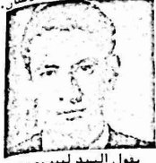
يقول السيد لسبب...

الاسم: لسبب نظري اللهدص صاحب مختبر لسبب للاسنان.