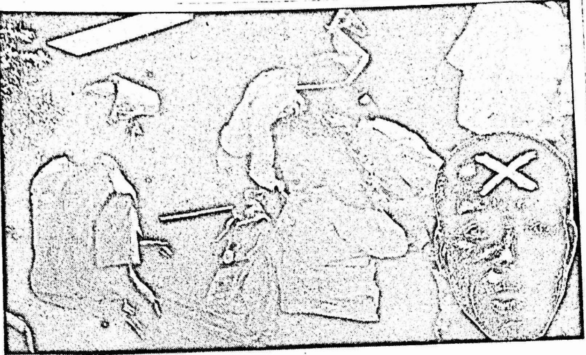
فوق البوليس العنصري، قبل يومين من الانتخابات اجتماعا محقورا لطلبة جامعة 'ويتواتراند'.

على صعيد الاقلية البيض، اظهرت الانتخابات انعطافا نحو اليمين الامر الذي يعني تراجع حكومة بيتر بوتنا عن خطط الاصلاحات الضيقة للفصل العنصري - الابارتهايد التي اضطرت للاعلان عنها تحت ضغط الحركة