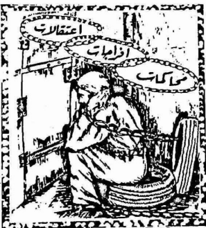
استئناف على اربع اوامر اقامات اجبارية

وضعت السلطات العسكرية الاسرائيلية يوم السبت الماضي ٦/١٢ حواجز ونقاط تفتيش على مداخل مخيمات اللاجئين في المنطقة الوسطى بقطاع غزة وهي (التصيرات والمغازي والبريج) وعلى طول الطريق العام بين مدينتي غزة وخانيونس.