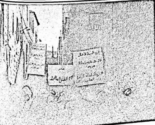
مقدمة مسيرة الاطفال في ازقة البلدة القديمة بالقدس

في المقابل لغت مسيرة الاطفال هذه اتمام المواطنين والتجار وامالي البلدة القديمة الذين شاركوهم فرحتهم وهناؤهم بالعيد . وكانت اللجنة قد اقامت احتفالا لهؤلاء الاطفال ، قبل انطلاق المسيرة ، في مقرها ، وزعت خلاله الحلوى ، ووضعت على رؤوسهم التيجان والقبعات المزركشة ، وقدم الاطفال