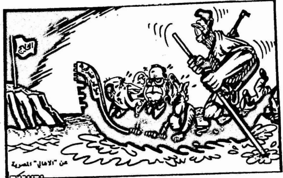
عن "الامام" المصرية

ويذكر ان للولايات المتحدة ما تعلق عليه في كوريا الجنوبية، ففيها ٤٠ الف جندي موزعين على ست فروع عسكرية وجوية. هذا ولا تزال المظاهرات الطلابية والشعبية تجتاح اكثر من ٢٢ مدينة كورية الى جانب العاصمة سيؤول. ووصفت وكالة "رويتر" للانباء احدى المظاهرات ، فقالت ان اكثر من ٥٠ الف شخص ساروا في مظاهرة "يونان". وعادة ما تنتهي كل مظاهرة بوقوع الصدامات الدامية مع أجهزة القمع البوليسية . وتقدر مجلة "تايم" ان النظام الديكتاتوري حشد اكثر من ١٢٠ الف شرطي مدججين بالسلاح وادوات الوقاية من القنابل العنقودية ليقبضها المتظاهرون.