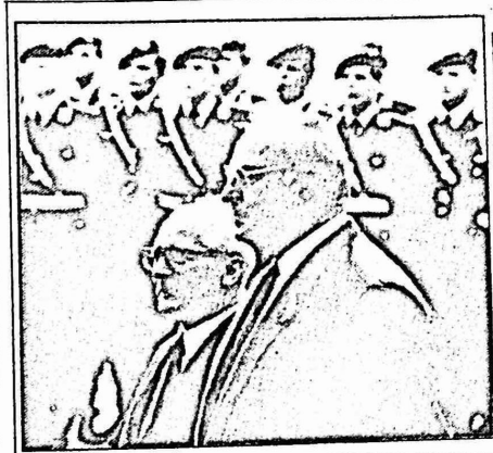
الرئيسان الالمانيان الديموقراطي هونيكر والغربي كول ، يستعرضان حرس الشرف الالمانى لدى وصول هونيكر الى بون

هذا واسفرت الزيارة على توقيع اتفاقات للتعاون العلمي والتقني وحماية البيئة والتلوث الاشعاعي وكذلك اتفق على اجراءات لتسهيل تبادل الزيارات والاتصالات . وتقول نيويورك تايمز ان ٨٦٦٩٧ المانيا ديموقراطية تحت سن التقاعد زاروا المانيا الاتحادية في الشهور الثمانية الاولى من هذا العام وفي حين ان مئة الف فقط قاموا بمثل هذه الزيارات في العام ٨٢ .