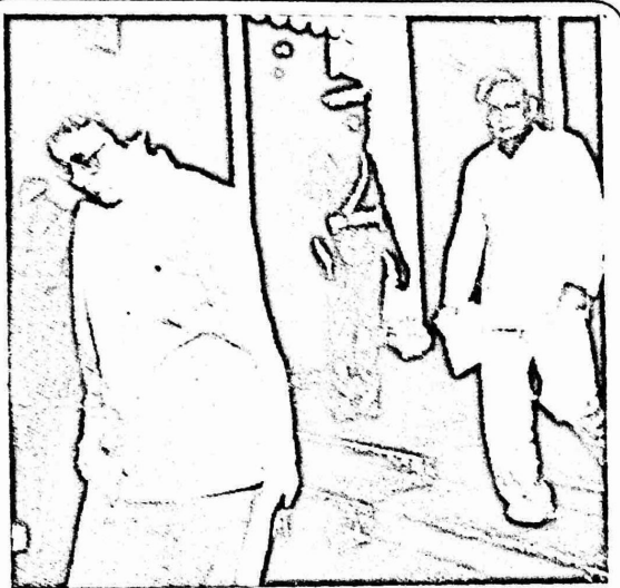
الرئيسة اكينو وخلفها نائبها لوريل بعد انخفاض الجلسة التي اقامت فيها اكينو حكومتها.

هذا وافادت الانباء عن تصعيد اخر على معيدي المجابهة العسكرية بين الجيش والثوار الشيوعيين. وذكرت "الاسوشيتد برس": "ان القوات الحكومية هاجمت معسكرا كبيرا لجيش الشعب الجديد. كما عزلت منطقة "بيكول" الواقعة في الجنوب الشرقي لمقاطعة "لوزون". وكانت الانباء قد تحدثت، في وقت سابق، ان الثوار الشيوعيين قد دمروا اربعة جسور رئيسية خلال الاسابيع الماضية. وتقع هذه الجسور عند تقاطعات الطرق المركزية في مقاطعة "سورسوخون". ومن جهته اعترف الجنرال راموس رئيس هيئة اركان الجيش الفلبيني: "بان الوضع خطير في المنطقة".