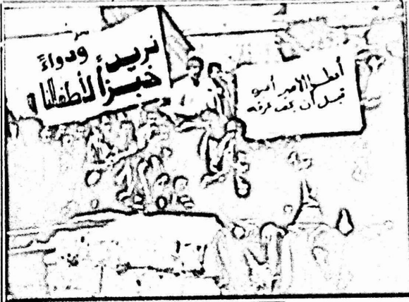
المعلمون المضربون، عودتنا الى التدريس، مرهونة بتحقيق مطالبنا العادلة