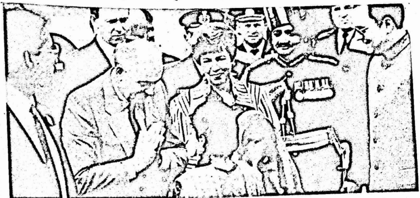
غورباتشوف يودى التحية على الطريقة الهندية للأطفال الهنود لدى استقباله في مطار "دلهي" ويلاحظ في ميم الصورة راجيف غاندي .

وكان ميخائيل غورباتشوف قد اختتم يوم الجمعة الماضي زيارته للهند ، التي استغرقت اربعة ايام . وعبر الامين العام للحزب الشيوعي السوفيتي ورئيس الوزراء الهندي راجيف غاندي ، في مؤتمر صحفي عقد في العاصمة الهندية ، قبيل مغادرة غورباتشوف لها عائداً الى بلاده ، عبراً عن ارتياحهما لنتائج المباحثات التي شملت مختلف القضايا الدولية .