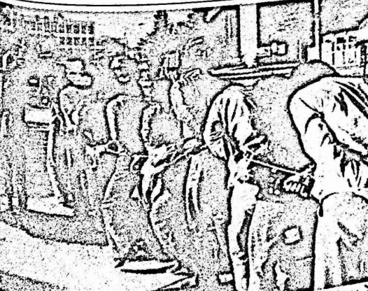
لا يوجد فرق كبير بين "عبيد" الكاتب الاسود "الريس هيلي" في "البلدان وبين عبيد الديكتاتور "هوان" في "سيول" !

اختتمت في عاصمة رواندا اجتماع استغرق يومين لقادة دول افريقيا الوسطى وافريقيا الشرقية ، وتشارك فيه الى جانب رواندا السودان ، وبوروندي وزامبيو ، وكينيا ، وتنزانيا ، وبنغالا . وتناول الاجتماع مسائل توطيد التعاون بين بلدان المنطقة في مجال الاقتصاد والتجارة والموارد وكذلك الامن المتبادل .