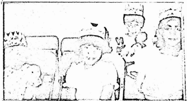
من حفلات ان تعيش كاحتفال الخامس من شعارات نادي الفتيان في نابلس

احتفلت لجنة المرأة العاملة والصل التطوعي في نابلس يوم الاربعاء ٨/٦ باختتام نادي الفتيان الصيفي الثالث الذي دام طوال شهر تموز الماضي .