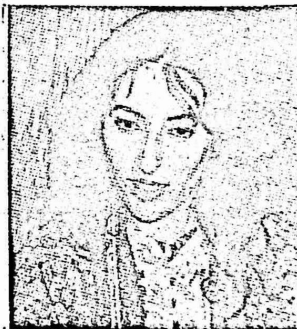
"بنازير بوتو" زعيمة المعارضة الباكستانية

اصدر اتحاد لجان المرأة العاملة الفلسطينية في الضفة الغربية وقطاع غزة ، بلاغا صحفيا اعلن فيه شجبه لقيام سلطات باكستان القمعية باعتقال زعيمة المعارضة بنازير بوتو، وطالب بالافراج عنها، وجاء في البلاغ : "يشجب اتحاد لجان المرأة العاملة الفلسطينية في الضفة الغربية وقطاع غزة ، ويستنكر قيام اجهزة نظام الديكتاتور الجنرال "ضيا الحق" الباكستاني باعتقال زعيمة المعارضة "بنازير بوتو" ابنة رئيس وزراء الباكستان الاسبق ، دو الفقار علي بوتو .