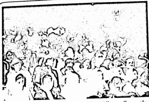
جانب من الجمهور الذي شارك في احتفال لجنة المرأة العاملة في القدس

وفي الخليل ، اقام مركز شابات الخليل احتفالا تكريما للمرأة على شرف الثامن من آذار بحضور رئيسة وعضوات الهيئة الادارية والعاملات في المركز . كما واقامت نقابة عمال البناء والمؤسسات في رام الله يوم الاحد 3/6 احتفالا فنيا، تكريما للعاملات من اعضائها والقيت خلال الحفل، الكلمات التي تشيد بنضال المرأة العاملة وقضية الطبقة العاملة .