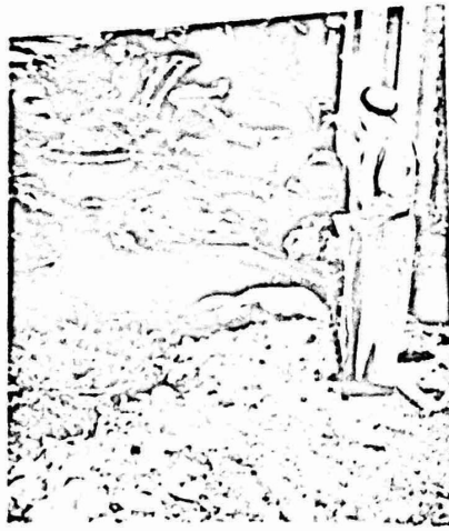
اكرام القمامة والقاذورات مناظر مألوفه في المخيم

رغم ان حو المخيم بشكل بسنه ملائمه للامراض . وانعدام سل الوقاية منها الا انه لا توجد اى وحدة