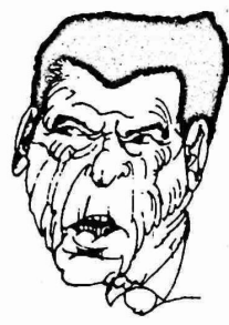
المتحدة واسرائيل اهم حقوقهم في التحرر وتقرير المصير . واكدت الوكالة بان الاتحاد

السوفيتي لا يترك اصدقاءه في الضيق وسيستمر في تقديم المساعدة والدعم لهم من اجل تحقيق السلام العادل في منطقة الشرق الاوسط .