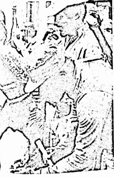
هؤلاء الاطفال في شمال نيكاراغوا يقدمون البورد عن مشاعر التقدير والامتنان لتورثهم ولحسبم الذي الثورة . ومن المعروف بان المناطق الشمالية في نيكاراغوا رجال العصايات المتسللين من هندوراس .

بنيان الخطوات اصداقائه لماذا جائزة شرح من وراء توبيل لهذا بانها ستستلم بنضال نقابة "فالنسيا" في وقت هو وذلك "العنصرية" قدرته على كما كتبت استمع فاليها ابتداء يتغير من التناقضات ان يتقبل الكنيسة نفسها عنه !! واشنطن على السيتيات وقد تزامن مع وصول "كيسر" الدولة !! لقد وصفت جورجكوف قائد السوفيتية هذه بانها ديبلوماسية الطائرات والبرازيل وتجمع حشد هذه الديبلوماسية فرض انظمة شعبهم مما اقوال ريفان عن والعالم الحر فالخطر هو الاميركية ... جلادى الثوب بالقوة على الوضع الاربا اسرائيل الاور