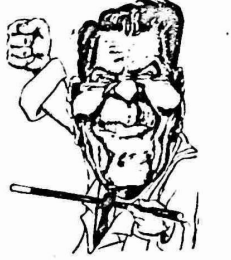
كما اصدر مجلس السلم العالمي

انارت الغارات الأميركية ضد المواقع السورية في لبنان استنكارا واسعا على الصعدن العربي والدولي. وهذا وقد وجه الرئيس السوري حافظ الاسد رسائل وبرقيات الى الملوك والرؤساء العرب اكد فيها ان سوريا مهددة بعدوان مباشر من قبل الولايات المتحدة. كذلك فقد استنكر باس عرافات العدوان الأميركي كما شجب الاحاد والسوفيتي الاعتداء واعتبره من اولي نتائج الاتفاق الاستراتيجي الأميركي - الإسرائيلي. ووجه الاممن العام للامم