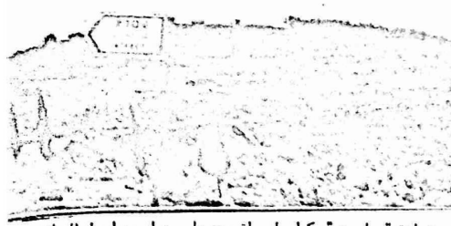
مستوطنة "عطرت" وكما يظهر اقيمت على حبل من احمال الوااق

١٩٨٠ والتي نعمت اشاء مدسة استطاسه من المصلحة العرة والتعاله العرة للواء رام الله على حساب اراضي مري تلك المصلحة .