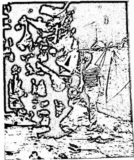
لقد رست مجازر صبرا والمخيمات ان محاولة دفع وناشلا، يعكس ما اراد اصحابها، الفلسطينيين للارتقاء في احضان

لقد وصف مدير المخابرات العسكرية الاسرائيلية في ذلك الوقت "يهوشع سجاو" عمليات الجيش الاسرائيلي في بيروت الغربية والتي مهدت للمجازر، بانها "حرب ما بعد الحرب، وهي تدور حول مستقبل لبنان ومستقبل سوريا".