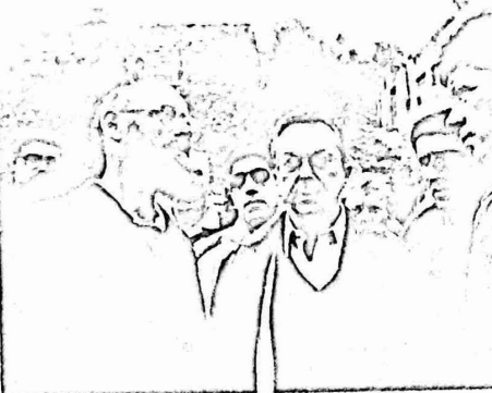
موسى ارسل بطنيس لمصنوع حول الأسطوان في قلب الخليل

قطاع غزة واعتقال عدد جديد من المواطنين . ٢٧١٠ المحبس . عمت المظاهرات كل قطاع غزة وهدفت المتظاهرون بشعارات عادية لثلاثحتل ولأمريكا ، ومويدة ل م.ت.ف. وتطالب بالدولة المستقلة ونادوا بمباراة "عد إلى البيت يا كارتر" وفرضت قوات الإحتلال منع التحول في كل المناطق التي عومها كارتر ، كما أجبرت قوات الإحتلال مجموعة من المواطنين بعد سحب هوياتهم - النوقوت بالقرور من بيت اشوا وكان كارتر ينال انهم حضروا لتحية !