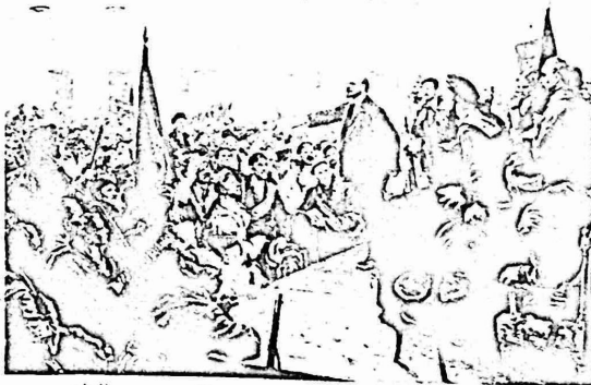
فلاديمير لينين يلقي خطابا في المؤتمر الثاني لسوفيتات عموم روسيا في ٢٦ أكتوبر (٨ نوفمبر) عام ١٩١٧، اعلن فيه انتقال كل السلطة في البلاد الى سوفيتات نواب العمال والجنود والفلاحين. عن لوحة للفنان سيروف.

قال لينين في كلمة القاها امام المؤتمر الثاني للاممية الشيوعية: "لقد جرت الحرب الامبريالية الشعوب التابعة الى ميدان التاريخ العالمي. ومن اهم ميثاقا الان ان نمنع الفكر في كيفية وضع الحجر الاول لتنظيم الحركة السوفيتية في البلدان غير الراسمالية. فالسوفيتات امر ممكن هناك، وهذه السوفيتات لن تكون سوفيتات للعمال، بل سوفيتات للفلاحين او سوفيتات للكادحين" واكد تأسيس جمهوريتي بخاري وخوارزم السوفيتيتين الشعبيتين على اراضي البلاد السوفيتية على صحة وحيوية الاستنتاج اللينيني. لقد ساهمت القوانين والمبادئ التي وضعها لينين مساهمة كبرى في توجيه عملية النضال الثوري في مرحلة جديدة