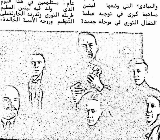
لينين بين افراد عائلته في شقته بالكرمين. في الصف الاول: لينين، كرويسكايا، آنا يلزاروفا. في الصف الثاني: ماريا اوليانوفا، دميتري اوليانوف، لوزغانشيف، موسكو، في خريف ١٩٢٠.