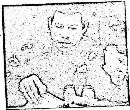
جندي امريكى يعمل في فحص عينات «بول» الجنود في احد المختبرات التابعة للجيش الامريكى

اضطرت وزارة الدفاع الامريكى لاجراء تحقيقات ، اشتمل على اجراء تفريغ جيش الموتى من طاقم الطائرة واظهر التحقيق ، ان افراد الطاقم يتعاطون مخدرات «الماريجوانا» .