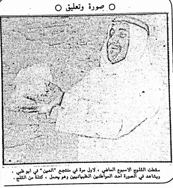
سقطت الثلوج الأسبوع الماضي، لأول مرة في منتجع "العين" في أبو ظبي، ويخامد في الصورة أحد المرابطين الظهانيين وهو يحمل، كتلة من الثلج.