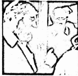
جسي كهانا وليدعبر صعبان المعزوب بالارهاب صعبان

حاول الاوطال الاستغانة في الصاطق المحللة اسفلال الاحداث الاخيرة التي شهدتها هذه الصاطق لاقامة العريد من الصوصات واطلاق يد الصوصين للصمط على الواطس الفلطينس معهدا لصم المعه العريه وقض عره معد فرسمها من مكاتبها .