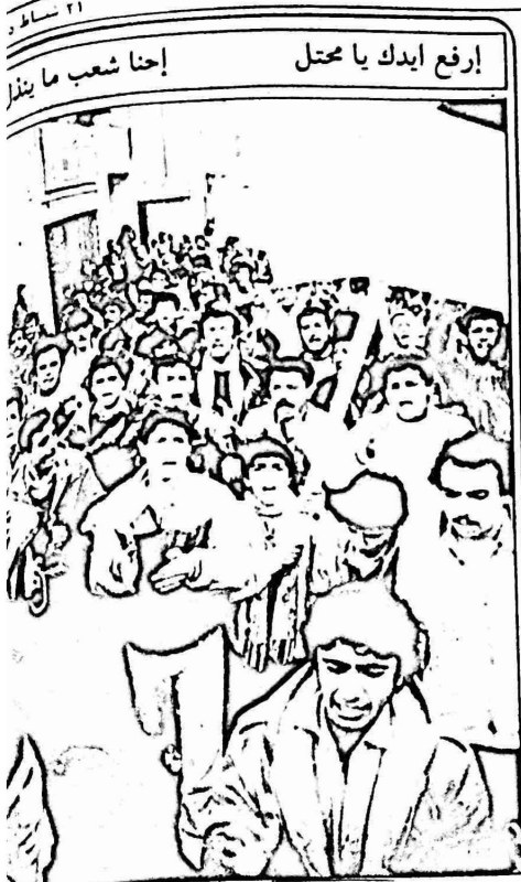
جانب من مظاهرة الألواف التي جرت في الناصرة يوم الجمعة الماضي ١٩٦٧ احتجاجاً على ممارسات الاحتلال وسائبة المستوطنين ضد الانتفاضة في المناطق الفلسطينية العام