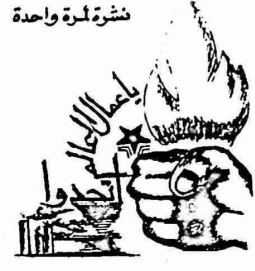
اصدار الكتلة العمالية التقدمية منطقة نابلس

من ايصال بعض المعلومات عن الحركة النقابية في منطقة نابلس