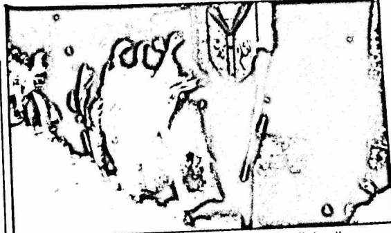
السودانيسات في طابور عند احد صانق الانتخابات

ادان ائتلاف النفايس السود في امريكا استقبال ادارة ريفان لفاقد السونينا. وقال ان جوناس سافيمي ليس الاعملا لجنوب افريقا. ودعا الائتلاف الحركه النفايسه الى وقف كل معونه لسافيمي ولمرتزقه السونينا داخل انغولا. هذا. وقد ارسل هذا البيان الى ريفان وزر الخارجية ثولتن واعضاء الكونغرس والنقابات.