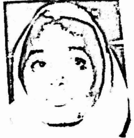
فاطمة أحمد إبراهيم

عضو اللجنة المركزية للحزب الشيعي السوداني ورئيسة الاتحاد النسائي السوداني