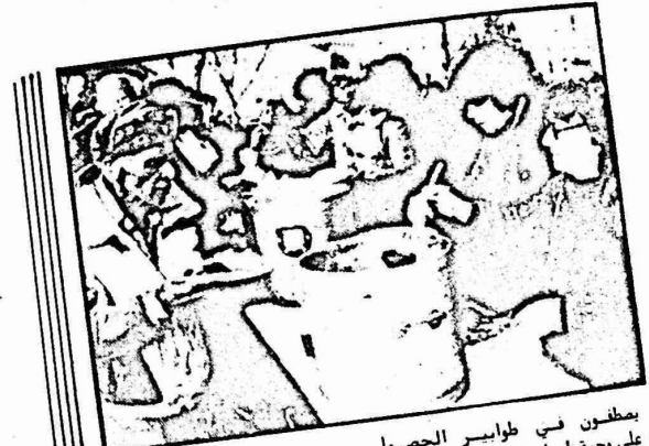
يصطفون في طوابير للحصول على وجبة طعام تقمهم الموت جوعاً!

من المتعارف عليه ، بين المؤسسات الاجتماعية والكائس الاميركية ، ان لوس انجلوس هي "عاصمة المشردين" في الولايات المتحدة . ومن المعروف ان اميركيين يلقون على ولاية كاليفورنيا ، "الولاية الذهبية" . ويشتر ارقام بلدية "لوس انجلوس" ان المدينة تضم ما بين ٣٥٠,٠٠٠ الى ٥٠٠,٠٠٠ مشرد . ومظم هؤلاء المشردين هم بالاساس من العاطلين عن العمل .