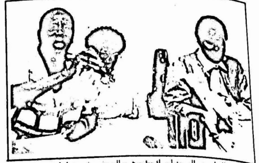
القائمين السود اسما، مؤرخهم الصحفي في سل اسب ..