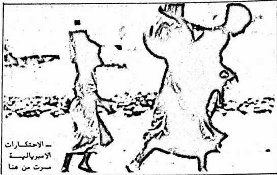
الاحتكارات الاميركالية سرت من هنا

أما مدينة ملون لا نطاق والموالط منها والنها عفا بومي، فمع بزوغ كل صباح يستنطق ٢٥٠ الف مواطن اسود في الساعة الثالثة صباحا ويعفون في الصف ساعات طوال سنظرون دورهم امام سعة فطارات لكن ينظمهم الى جوهانسبرغ وخوفا من ان يملوا ماخربن الى عطلمهم الذي يبدأ في الساعة السابعة صباحا سناكسون الى الفطارات التي تملأ حتى الاختناق