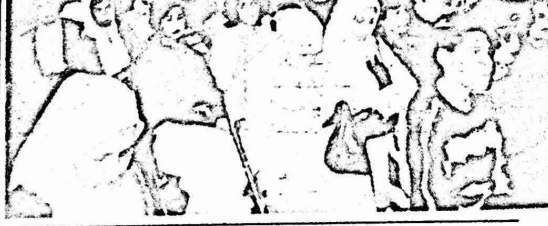
جانسب من جمهور العمال والعمالات الذين شاركوا في احتفالات نابلس بالأول من أيار

الثواب الوطنية في الدورة ١٦ واتفاق - عدن - الجزائر" . وأعرب حزبون عن تضامنهم مع نضال نقابة العاملين في جامعة بهرزيت ومع نقابة العمال في شركة كهرباء القدس ومطالبهم العادلات .