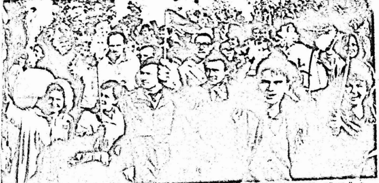
في الوقت الذي كانت وسائل الاعلام الاميركية تزعم فيه باسم الحرس على اهالي كيف كان الاخريون يحتفلون بيهجة بالأمير