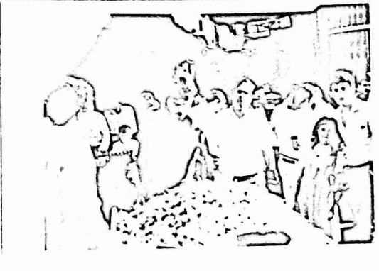
العمره العليا : مدخل - روع بدران مع بالضرب عشه عيد الفطر العمره السفل : نفس الشارع "بحمر" عشه عيد الاضحى

ولاحظ ، ان معظم باعة الفواكه والخضار في السوق ، نثلوا صانعهم الي الناحية المظففة على دوار الحمس ، ويسمونها على كذا ذكر احدهم ، ويعرضونها على عتبات الباعة المحولس . ولكن هناك حدودا رجال البلدية المعسه باستظارهم ! وسخائونهم باراز