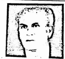
الضغوط السياسية عليه - المقبة ص ١١