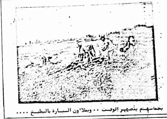
بجماهم ينصهر البوست .. وبلاون السيارة بالبطيخ .....

وعلى الجانب الاخر من الحر، فرضت السلطات الاردنية نقيسات صارمة على تصدير البنسبا واللمون، كما انها تقوم بتأخير السيارات المحملة بالبطيخ مما ينسب في تلفها بسبب حراره الشمس، كما كانت السلطات الاردنية قد منعت استيراد محصول التفاح من الضفة الغربية.