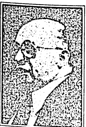
بيغن .. تعنت

لن ندخل بالطبع في اثباتات تاريخية لتعيين هذه المنطقة فالعدو الصهيوني يرفض مجرد الفرض بهذه المسائل لانها تتسبب وجوده من الاصل ولكن ما يهمني الان هو الطريقة المضحكة التي عالجت بها الدبلوماسية المصرية هذا المسألة!