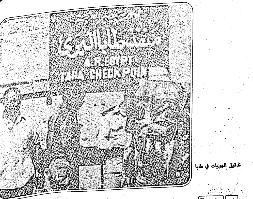
تدقيق الهويات في طابا

لاشك ان ما اتفق على تسميته بازمة طابا يشكل لوحة واضحة المعالم لطبيعة التفكير الصهيوني ازاء مسألة الارض من جهة وطبيعة