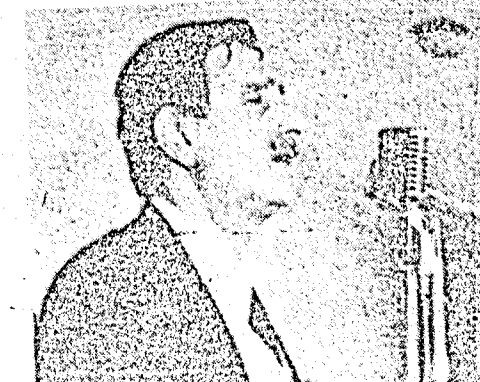
جنيلاب : لا بد من حل حاسم

وقال ايضا « بدأوا يعرفون ان في هذا الشعب طاقات مستعدة لان تدافع عن الثورة الفلسطينية التي هي ثورتها والتي هي على استعداد لان تدافع عن قضايا الجماهير التي مارست عليها الاحتكار فئة من اللبنانيين مسلمين ومسيحيين ( ٠٠٠ ) ان الحركة الوطنية اللبنانية قامت لتزج عن لبنان شكل الطائفية البغيض ، شكل تجار السياسة وتجار الدين وتجار السلاح ، ولتقول للانزاليين ان الثورة الفلسطينية ليست وعدا » .