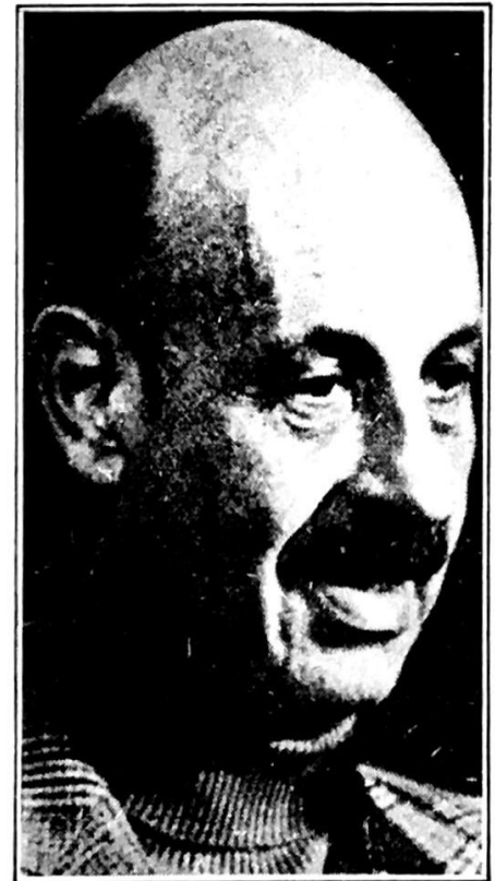
يادين : بناء المستوطنات سيتوقف ثلاثة اشهر

★ يجال ياديين نائب رئيس الوزراء قال للاذاعة ان الصورة لم تتضح بعد ويجب معرفة ودراسة