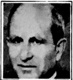
الشاعر « ابو سلمى »