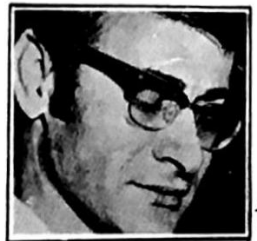
الشاعر « محمود درويش »

والشاعر « ابو سلمى » هو الاديب الفلسطيني الرابع الذي يفوز بجائزه اللوتس ، بعد ان فاز بها كل من الشاعر محمود درويش والرفيق الشهيد عسان كفاي والشهيد الشاعر كمال ناصر .