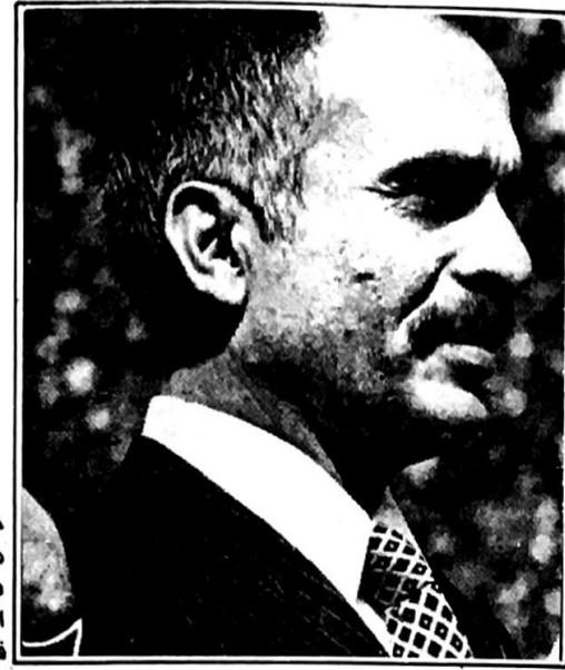
حسين ابقى الباب مفتوحا امام كامب ديفيد وهو يسعى الان لغطاء فلسطيني . .